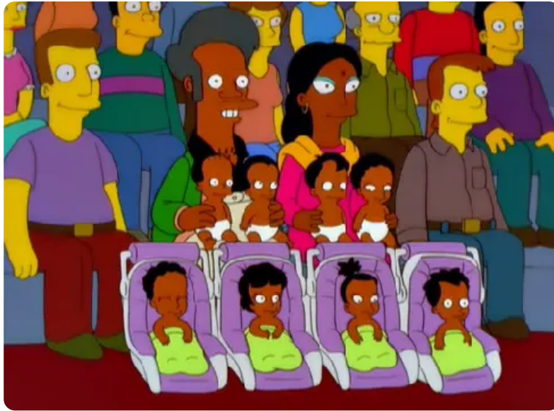
Imagen destinada a descomprimir emocionalmente. MIREN, BEBITOS!!!